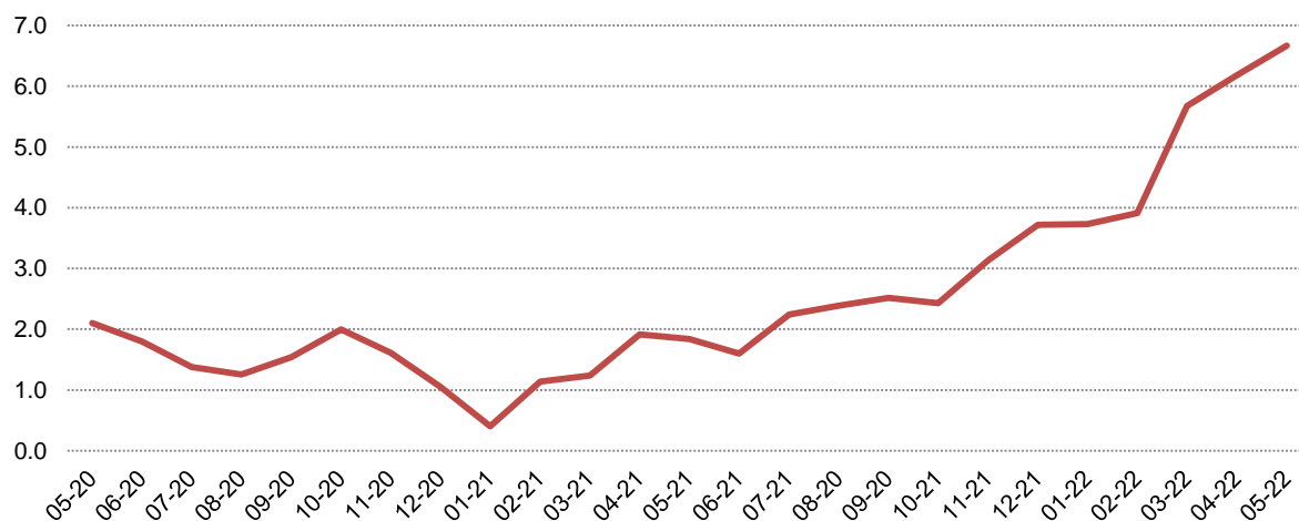
Fig. 1 Ndryshimet vjetore të Indeksit të çmimeve të konsumit (%)

Ndryshimi vjetor i indeksit të çmimeve të konsumit në muajin Maj 2022 është 6,7 %, një vit më parë ky ndryshim ishte 1,8 %. Ndryshimi mujor i indeksit të çmimeve të konsumit në muajin Maj 2022, krahasuar me Prill 2022 është -0,5 %.