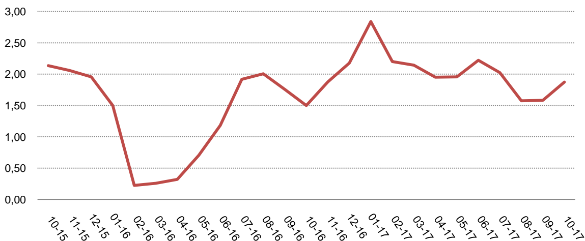
Fig. 1 Ndryshimet vjetore të Indeksit të çmimeve të konsumit (%)

Në muajin Tetor 2017 ndryshimi vjetor i indeksit të çmimeve të konsumit është 1,9 %. Një vit më parë ky ndryshim ishte 1,5 %.