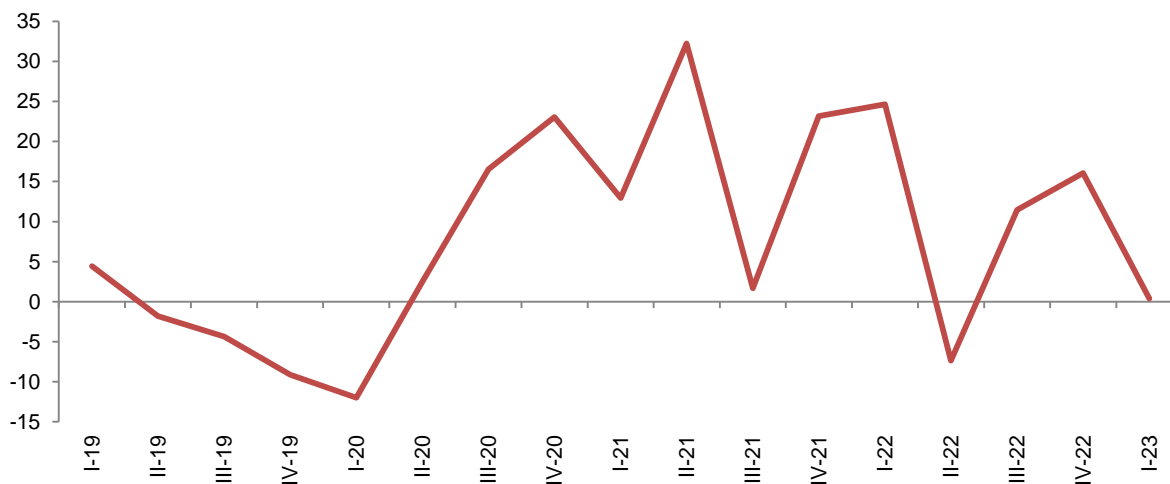
Fig. 4 Ndryshimet vjetore të Indeksit të shitjeve neto, Ndërtim (%)