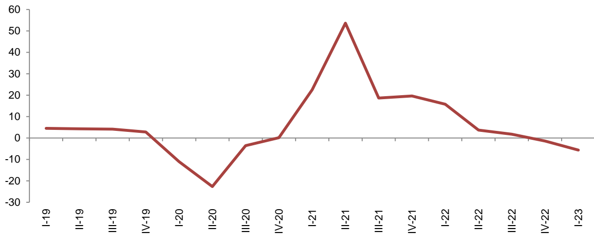
Fig. 1 Ndryshimet vjetore të Indeksit të shitjeve neto në volum, Industri (%)