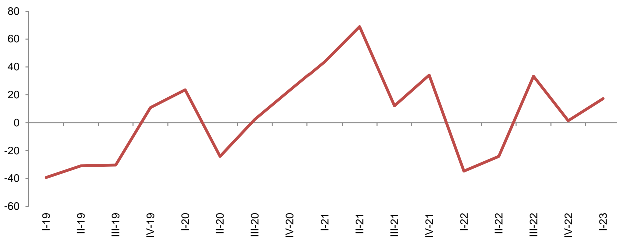
Fig. 2 Ndryshimet vjetore të Indeksit të prodhimit në volum, Energji elektrike, Gaz, Avull (%)