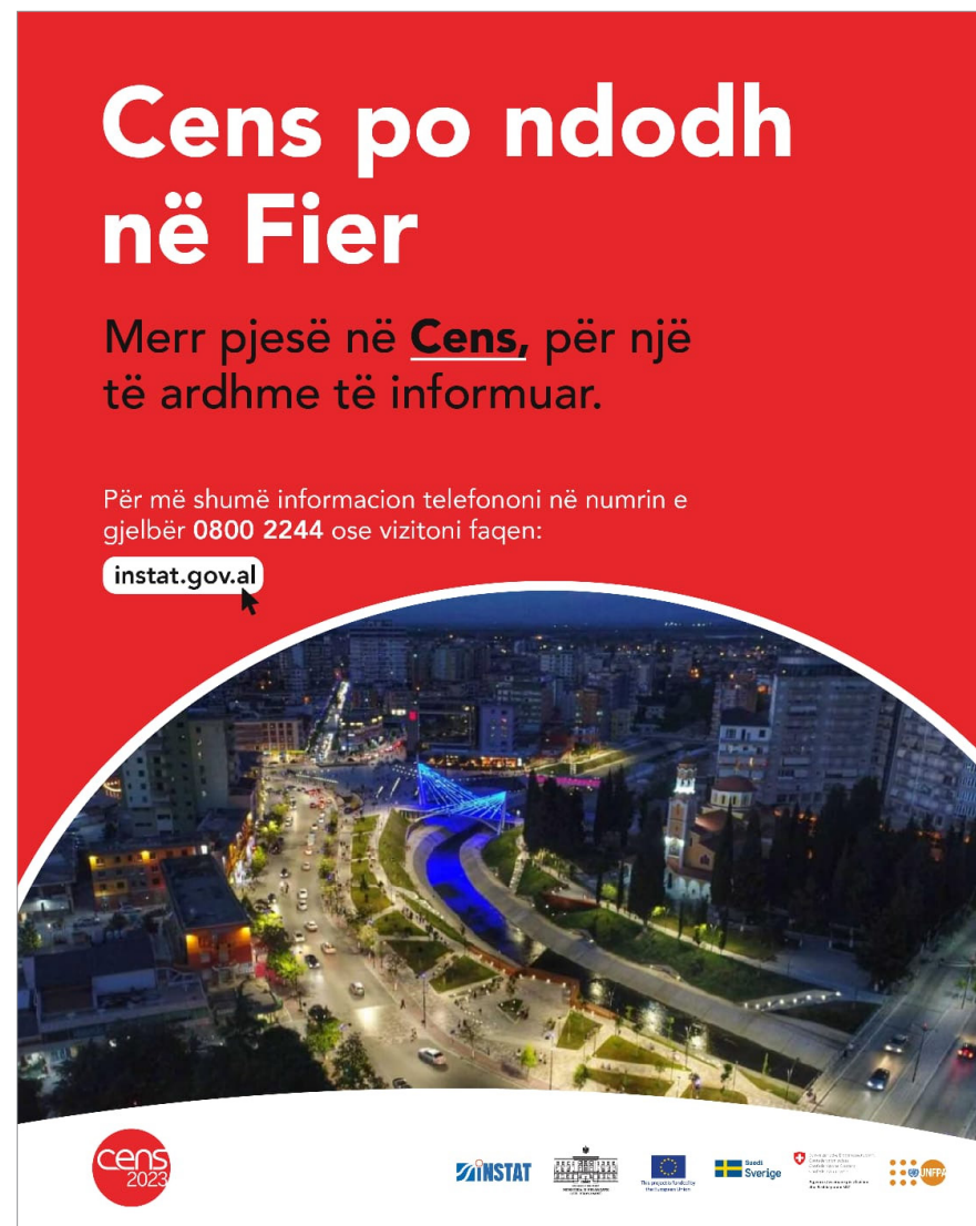
Figura: Poster i Censit Figure: Census Poster

Ligji për Statistikat Zyrtare, për Censin e Popullsisë dhe Banesave dhe për Mbrojtjen e të Dhënave Personale përcaktuan rregullat për konfidencialitetin dhe mbrojtjen e të dhënave në Cens. Ligjet parashikojnë që të dhënat e mbledhura nga Censi përdoren vetëm për qëllime statistikore, në përputhje me standardet dhe rekomandimet e Eurostat dhe UNECE. Mbledhja dhe përpunimi i të dhënave personale kryhet duke respektuar dhe garantuar të drejtat dhe liritë themelore të njeriut, veçanërisht të drejtën për privatësi. Sipas këtyre ligjeve, rezultatet e shpërndara të Censit nuk mund t’i referohen individëve të veçantë dhe nuk duhet të përmbajnë identifikues personale ose informacione që mund të çojnë në identifikimin e individëve. Konfidencialiteti i të dhënave nuk kërkohet vetëm për shpërndarjen e rezultateve të Censit, por gjatë gjithë fazave të tij: nga mbledhja fillestare e të