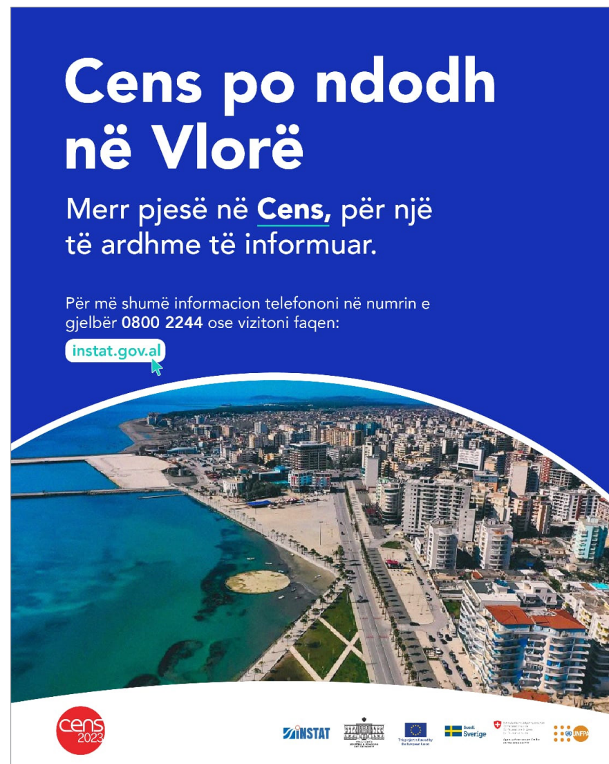
Figura: Poster i Censit Figure: Census Poster

Ligji për Statistikat Zyrtare, për Censin e Popullsisë dhe Banesave dhe për Mbrojtjen e të Dhënave Personale përcaktuan rregullat për konfidencialitetin dhe mbrojtjen e të dhënave në Cens. Ligjet parashikojnë që të dhënat e mbledhura nga Censi përdoren vetëm për qëllime statistikore, në përputhje me standardet dhe rekomandimet e Eurostat dhe UNECE. Mbledhja dhe përpunimi i të dhënave personale kryhet duke respektuar dhe garantuar të drejtat dhe liritë themelore të njeriut, veçanërisht të drejtën për privatësi. Sipas këtyre ligjeve, rezultatet e shpërndara të Censit nuk mund t’i referohen individëve të veçantë dhe nuk duhet të përmbajnë identifikues personale ose informacione që mund të çojnë në identifikimin e individëve. Konfidencialiteti i të dhënave nuk kërkohet vetëm për shpërndarjen