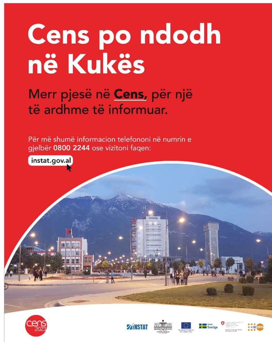
Figura: Poster i Censit Figure: Census Poster

Ligji për Statistikat Zyrtare, për Censin e Popullsisë dhe Banesave dhe për Mbrojtjen e të Dhënave Personale përcaktuan rregullat për konfidencialitetin dhe mbrojtjen e të dhënave në Cens. Ligjet parashikojnë që të dhënat e mbledhura nga Censi përdoren vetëm për qëllime statistikore, në përputhje me standardet dhe rekomandimet e Eurostat dhe UNECE. Mbledhja dhe përpunimi i të dhënave personale kryhet duke respektuar dhe garantuar të drejtat dhe liritë themelore të njeriut, veçanërisht të drejtën për privatësi. Sipas këtyre ligjeve, rezultatet e shpërndara të Censit nuk mund t’i referohen individëve të veçantë dhe nuk duhet të përmbajnë identifikues personale ose informacione që mund të çojnë në identifikimin e individëve. Konfidencialiteti i të dhënave nuk kërkohet vetëm për shpërndarjen