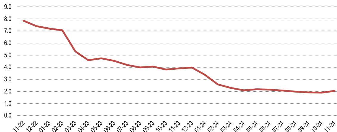
Fig. 1 Ndryshimet vjetore të Indeksit të çmimeve të konsumit (%)

Ndryshimi vjetor i indeksit të çmimeve të konsumit në muajin Nëntor 2024 është 2,0 %, një vit më parë ky ndryshim ishte 3,9 %. Ndryshimi mujor i indeksit të çmimeve të konsumit në muajin Nëntor 2024, krahasuar me Tetor 2024 është -0,02 %.