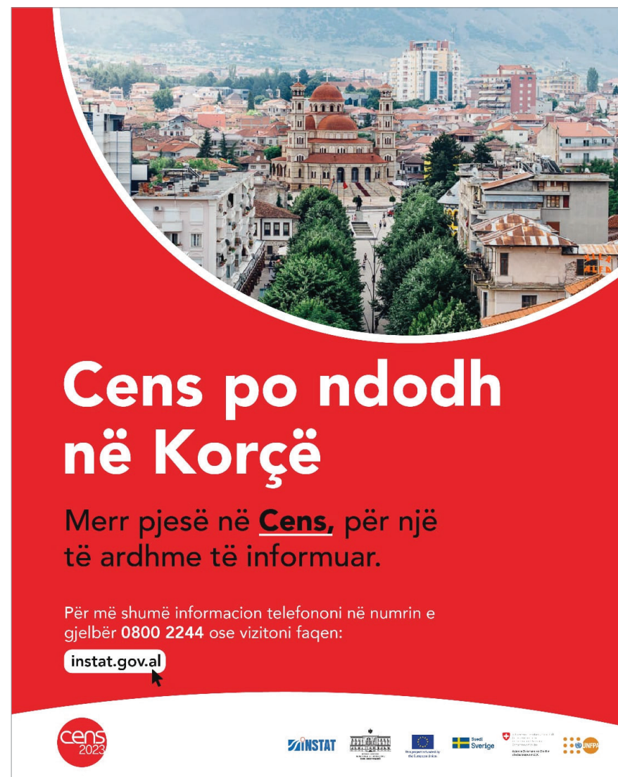
Figura: Poster i Censit Figure: Census Poster

Ligji për Statistikat Zyrtare, për Censin e Popullsisë dhe Banesave dhe për Mbrojtjen e të Dhënave Personale përcaktuan rregullat për konfidencialitetin dhe mbrojtjen e të dhënave në Cens. Ligjet parashikojnë që të dhënat e mbledhura nga Censi përdoren vetëm për qëllime statistikore, në përputhje me standardet dhe rekomandimet e Eurostat dhe UNECE. Mbledhja dhe përpunimi i të dhënave personale kryhet duke respektuar dhe garantuar të drejtat dhe liritë themelore të njeriut, veçanërisht të drejtën për privatësi. Sipas këtyre ligjeve, rezultatet e shpërndara të Censit nuk mund t'i referohen individëve të veçantë dhe nuk duhet të përmbajnë identifikues personale ose informacione që mund të çojnë në identifikimin e individëve. Konfidencialiteti i të dhënave nuk kërkohet vetëm për shpërndarjen