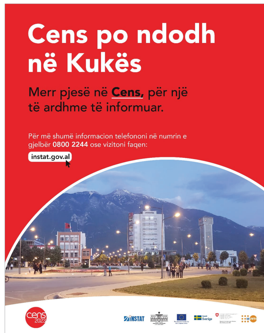
Figura: Poster i Censit Figure: Census Poster

Ligji për Statistikat Zyrtare, për Censin e Popullsisë dhe Banesave dhe për Mbrojtjen e të Dhënave Personale përcaktuan rregullat për konfidencialitetin dhe mbrojtjen e të dhënave në Cens. Ligjet parashikojnë që të dhënat e mbledhura nga Censi përdoren vetëm për qëllime statistikore, në përputhje me standardet dhe rekomandimet e Eurostat dhe UNECE. Mbledhja dhe përpunimi i të dhënave personale kryhet duke respektuar dhe garantuar të drejtat dhe liritë themelore të njeriut, veçanërisht të drejtën për privatësi. Sipas këtyre ligjeve, rezultatet e shpërndara të Censit nuk mund t'i referohen individëve të veçantë dhe nuk duhet të përmbajnë identifikues personale ose informacione që mund të çojnë në identifikimin e individëve. Konfidencialiteti i të dhënave nuk kërkohet vetëm për shpërndarjen