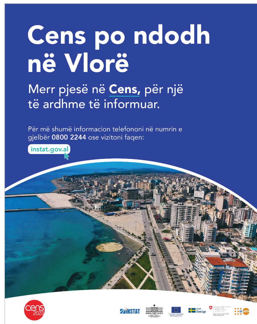
Figura: Poster i Censit Figure: Census Poster

Ligji për Statistikat Zyrtare, për Censin e Popullsisë dhe Banesave dhe për Mbrojtjen e të Dhënave Personale përcaktuan rregullat për konfidencialitetin dhe mbrojtjen e të dhënave në Cens. Ligjet parashikojnë që të dhënat e mbledhura nga Censi përdoren vetëm për qëllime statistikore, në përputhje me standardet dhe rekomandimet e Eurostat dhe UNECE. Mbledhja dhe përpunimi i të dhënave personale kryhet duke respektuar dhe garantuar të drejtat dhe liritë themelore të njeriut, veçanërisht të drejtën për privatësi. Sipas këtyre ligjeve, rezultatet e shpërndara të Censit nuk mund t’i referohen individëve të veçantë dhe nuk duhet të përmbajnë identifikues personale ose informacione që mund të çojnë në identifikimin e individëve. Konfidencialiteti i të dhënave nuk kërkohet vetëm për shpërndarjen