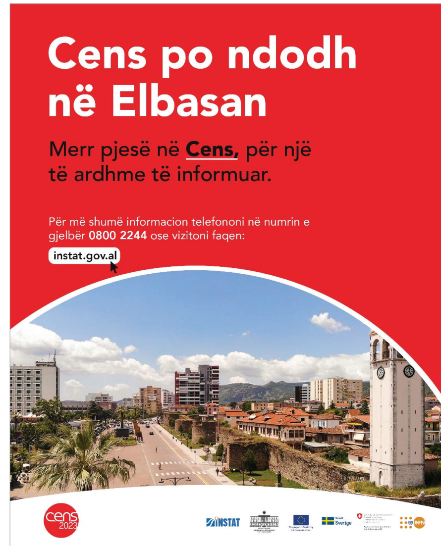
Figura: Poster i Censit Figure: Census Poster

Ligji për Statistikat Zyrtare, për Censin e Popullsisë dhe Banesave dhe për Mbrojtjen e të Dhënave Personale përcaktuan rregullat për konfidencialitetin dhe mbrojtjen e të dhënave në Cens. Ligjet parashikojnë që të dhënat e mbledhura nga Censi përdoren vetëm për qëllime statistikore, në përputhje me standardet dhe rekomandimet e Eurostat dhe UNECE. Mbledhja dhe përpunimi i të dhënave personale kryhet duke respektuar dhe garantuar të drejtat dhe liritë themelore të njeriut, veçanërisht të drejtën për privatësi. Sipas këtyre ligjeve, rezultatet e shpërndara të Censit nuk mund t’i referohen individëve të veçantë dhe nuk duhet të përmbajnë identifikues personale ose informacione që mund të çojnë në identifikimin e individëve. Konfidencialiteti i të dhënave nuk kërkohet vetëm për shpërndarjen e rezultateve të Censit, por gjatë gjithë fazave të tij: nga mbledhja fillestare e të